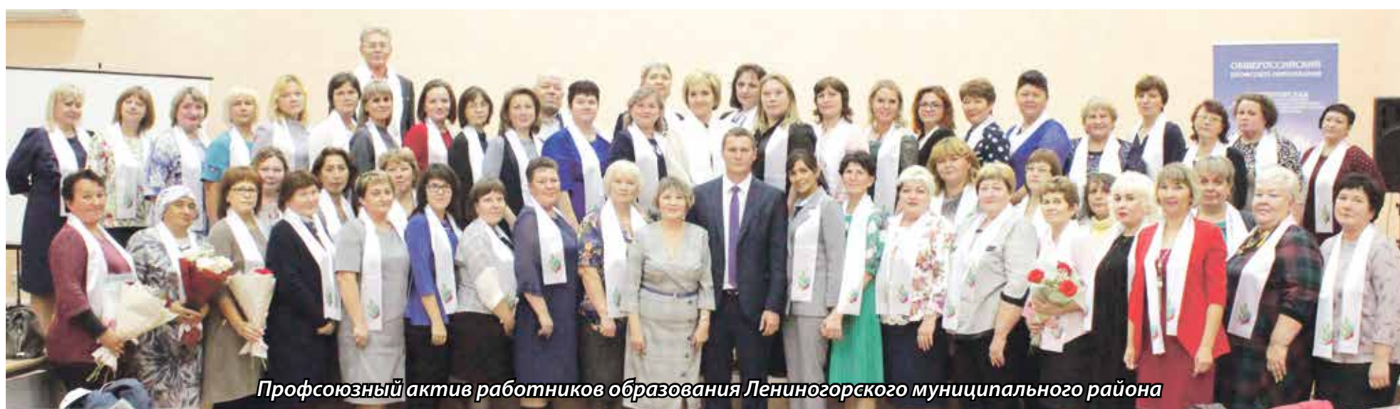
Профсоюзный актив работников образования Лениногорского муниципального района